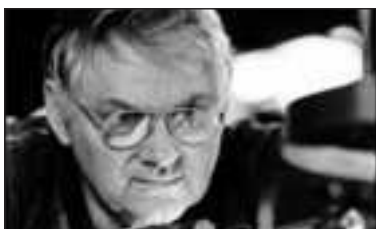
Сотрудники KSB – Мы приводим Ваш мир в движение

Амасан К – это надежный насос для сложных случаев. Чувствует себя как дома в средах, где другая гидравлика для трубных каналов давно сдалась.