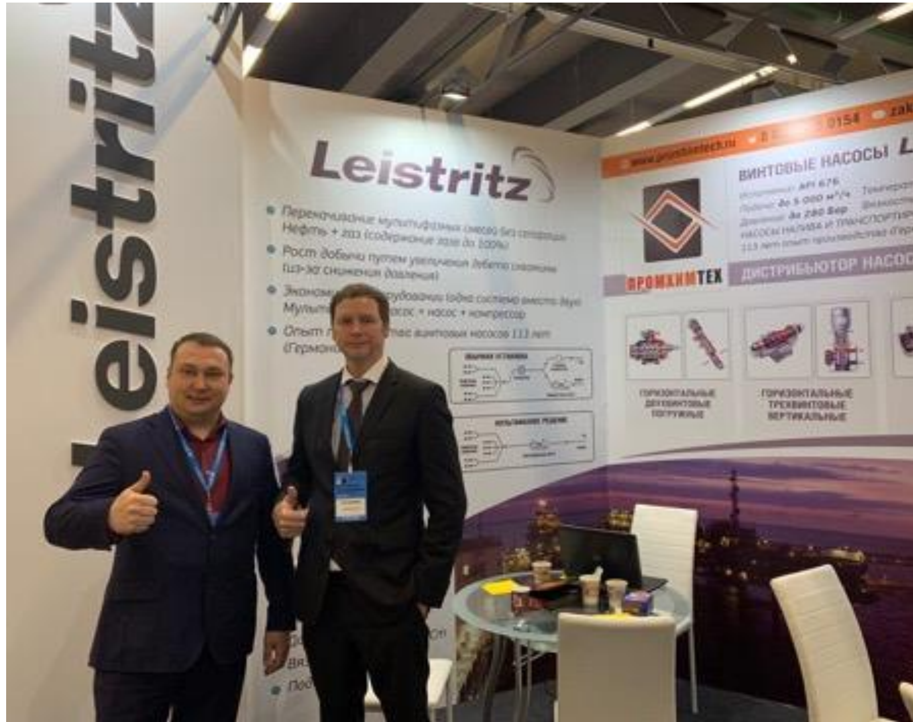
Нефтегаз 2019, Москва