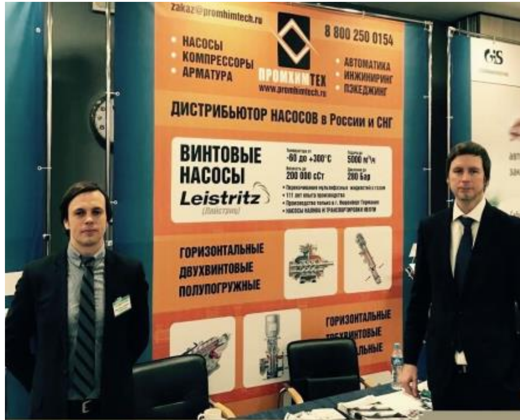
Конференция Downstream 2017 , Тюмень