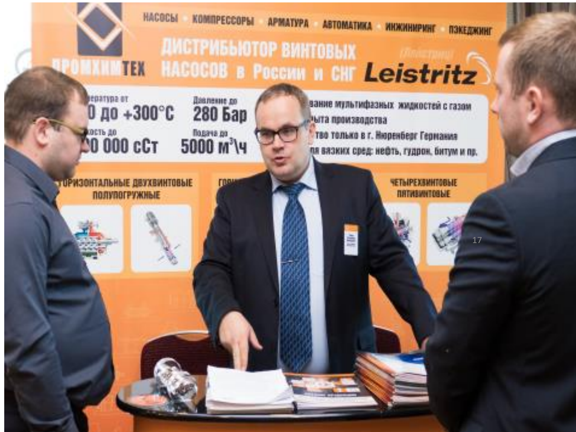
САММИТ нефтепереработка 2017, Москва