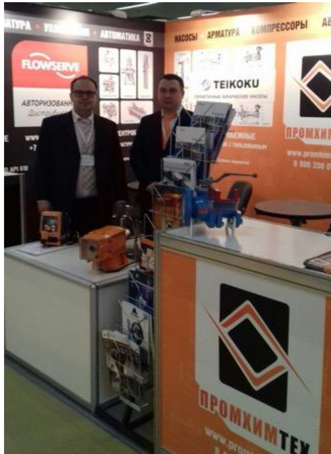
Нефтегаз 2018, Москва